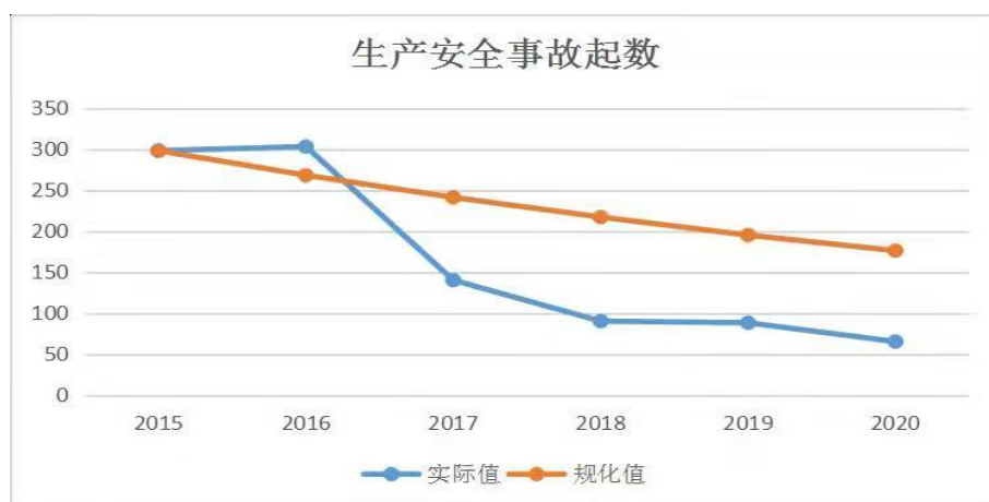
图 1 生产安全事故起数

1. 事故起数大幅下降。 “十三五”期间，我市没有发生重大及以上事故。2020 年较大事故起数 1 起，相比 2015 年下降 66.7%，相比 2016 年下降 50%。2020 年生产安全事故起数 65 起，相比 2015 年下降 78.2%，年均降幅 15.6%；相比 2016 年下降 78.5%，年均降幅 19.6%。