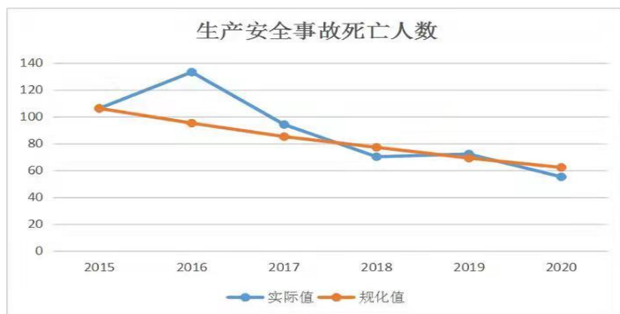
图3 生产安全事故死亡人数

2. 死亡人数明显减少。2020 年生产安全事故死亡人数 55 人，相比 2015 年下降 48.1%，年均降幅 9.6%；相比 2016 年下降 58.6%，年均降幅 11.7%。2020 年较大事故死亡人数 4 人，相比 2015 年下降 63.6%，年均降幅 12.7%；相比 2016 年下降 55.6%，年均降幅 11.1%。